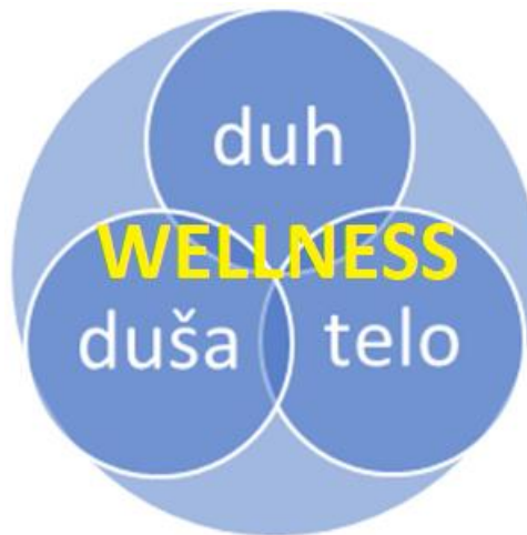
Slika: Trojstvo ljudskog bića

Najpre ćemo da se osvrnemo ljudsko biće čini celina od tri postoje osobe koje veruju samo u veruju u postojanje duha (duh i ćemo ovde predstaviti čoveka zbog toga što najveće religije tri celine i drugo, samim tim trihotomne osobe, dakle veruju u Velnes podržava holistički elementa pojedinačno tako i sve